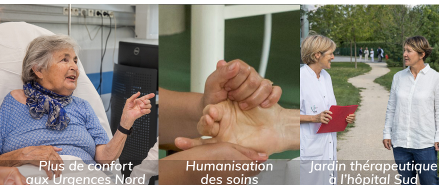
Plus de confort aux Urgences Nord